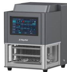
全自动平行浓缩仪 浓缩