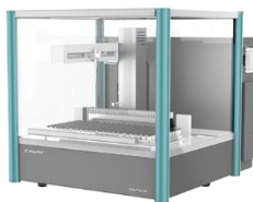
全自动液体样品处理工作站 标曲配制

睿科 Raykol EVA 80 全自动平行浓缩仪处理通量高，80 个样品可同时进行氮吹，实验平行性好；而且采用氮吹针自动追随液面的设计，无需手动调节氮吹针且耗气量小，省时省力。