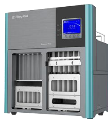
全自动固相萃取仪 净化